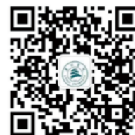
二级学院联系方式